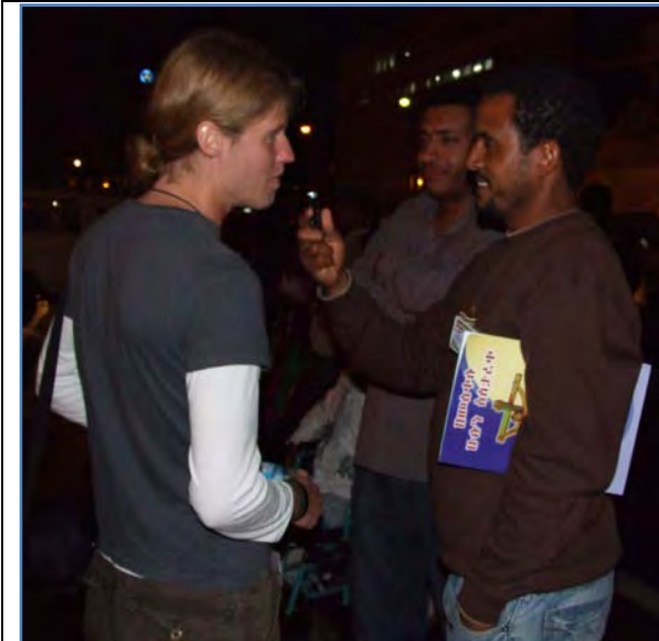
Some Volunteers had interview on media about Meskel Festival