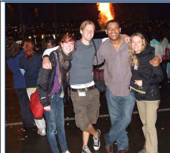
Volunteers and Sami at Meskel festival