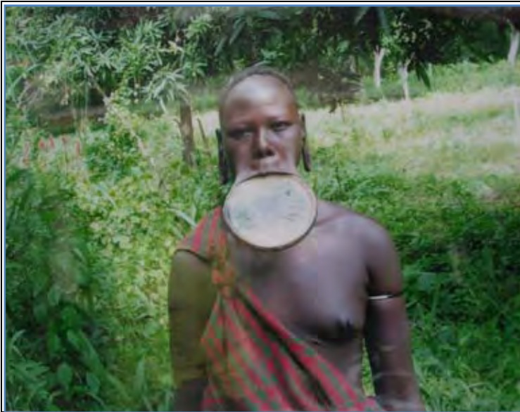
A photo from southern part of Ethiopia - one of the trip women decorated in a clay on her lip.