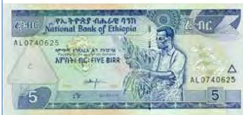
Five Birr note