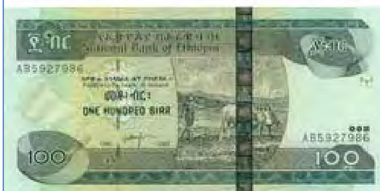
Hundred Birr note