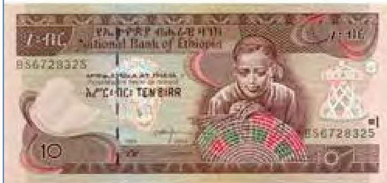
Ten Birr note