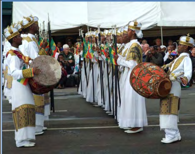
Sunday School youth at Meskel festival