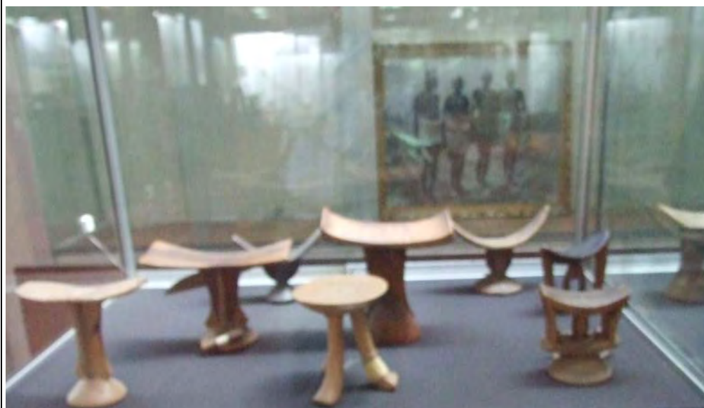
Head rest from a Southern trips in Ethiopia