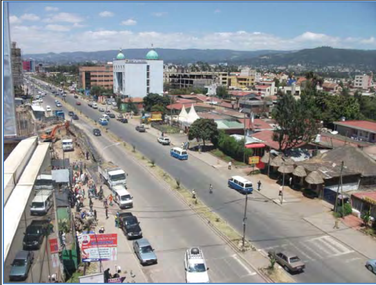
Addis Ababa City - a view from journalism volunteers placement building