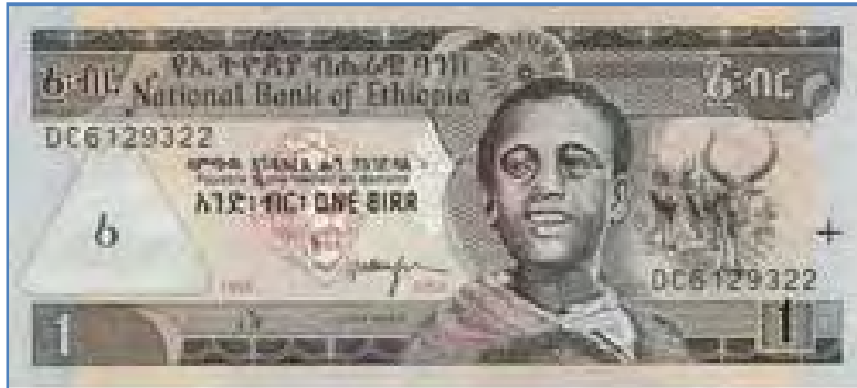
One Birr note

Ethiopia's currency is called Birr. It's divided into 100 cents in 1, 5, 10, 25 and 50 cent coins, and there are 1, 5, 10, 50 and 100 Birr notes.